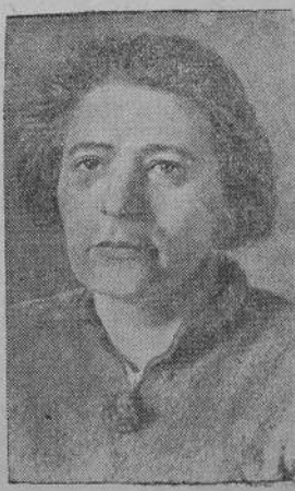
Анна Паукер — одна из активных деятельниц рабочего движения в Румынии, долгое время находившаяся в заключении. В результате переговоров между правительствами СССР и Румынии тов. Паукер освобождена из тюрьмы. Она прибыла в СССР и находится в Москве.

На полях Советского Союза к 15 мая засеяно 45431000 гектаров яровых — 48 проц. плана. В северных, центральных и восточных областях из-за метеорологических условий сев начался значительно позднее, чем в прошлом году.